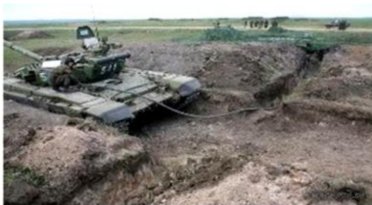
Рис. 3. Заправка паливом шляхом підходу засобів заправки до ОВТ (другий спосіб заправки)

Другий спосіб. Засоби транспортування та заправки паливом подаються до ОВТ (рис. 3). Другий спосіб заправки паливом ОВТ в ході ведення бою можна використовувати, як для батальйонів другого так і першого ешелону (рот другого ешелону батальйону) військової частини, в залежності від бойової обстановки.