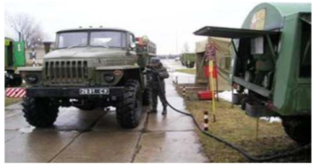
Рис. 2. Заправка паливом шляхом підходу ОВТ до засобів заправки (перший спосіб заправки)

Перший спосіб. ОВТ підходить до засобів транспортування та заправки паливом (рис. 2).